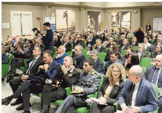
Uno scorcio della platea alla Camera di Commercio

Ecco le 38 imprese protagoniste in questi mesi della lunga carrellata di storie raccontate attraverso la rassegna "L'impresa si racconta" e i cui titolari sono stati premiati ieri pomeriggio in Camera di Commercio: Blue Mama, Ristorante La Pergoletta, Caffè Enrico, Nautica Sandroni, Ristorante Gulliver, Ristorante L'Artilafo, Pasticceria Frangioni, Macelleria Ciampalini, Pasticceria Solforetti, Macelleria Cappagli, Novi Egidio, Trattoria da Stelio, Ottica Brandi, Massimo Dei, Edilcomes, Arno Cornici, Giuli Boutique, Mc Impianti, Intergomma Service, Giusti Auto (tutti di Pisa), Venus di Pettinelli di Pontedera, Macelleria Desideri di Pontedera, Egidio Massei di Pontedera, La Casa della Parrucca di Pontedera, Gioielleria Nardi di Bientina, Agriturismo Il Cerreto di Pomarance, Panificio Valgraziosa di Calci, Carrozzeria La Certosa di Calci, Pasticceria Lemmi di Cascina, Ferrante Costruzioni di Cascina, Hotel 4 Gigli di Montopoli, Ottica Simonelli di Ponsacco, Gemignani Arreda di Ponsacco, Tages di S. Giuliano, Macelleria Lo Scalco di San Miniato, Savini Tartufi di Forcoli, Parkpre Bicycles e Del Moro (entrambi di Vicopisano).